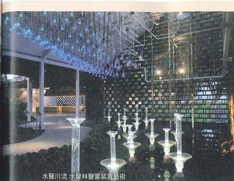
水聲川流 水聲林聲響裝置藝術