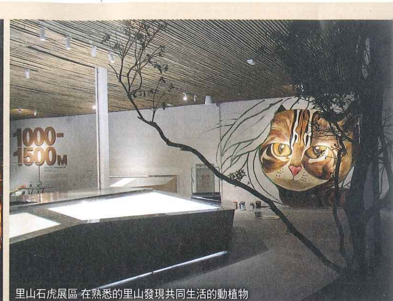
里山石虎展區 在熟悉的里山發現共同生活的動植物