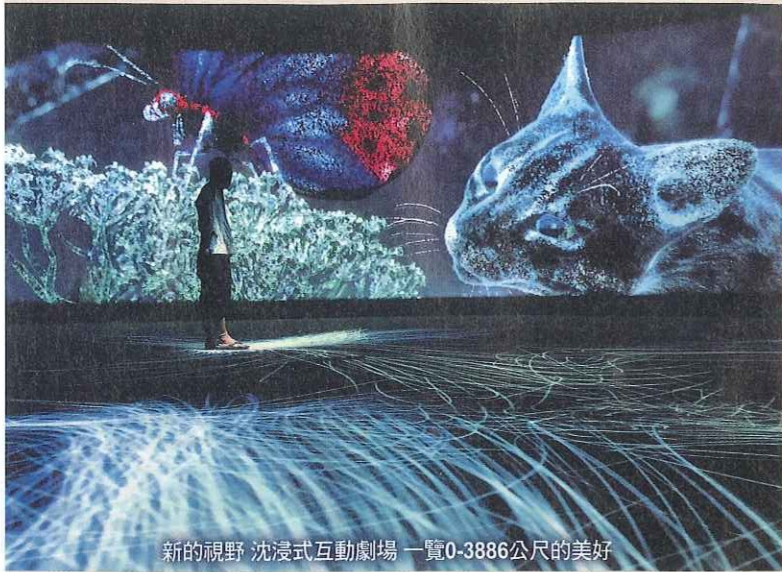
新的視野 沉浸式互動劇場 一覽0-3886公尺的美好