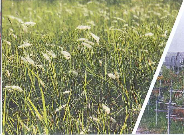
↓在高速公路或鐵道旁常見的野草花「白茅」，其實在台灣已經存在四、五百年。快來高鐵野草地圖中尋寶。